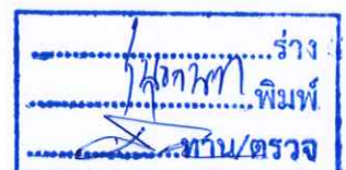
(นายอนุสรณั้ ศรีนาราง) สทกรณั้จังหวัดเพชชชบูนรณั้